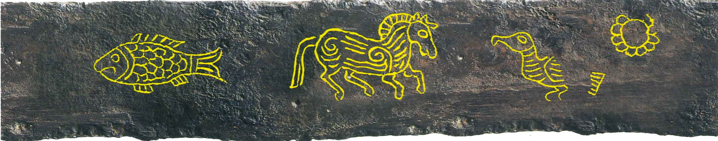
江田船山古墳から出土した銀象嵌銘大刀(ぎんそうがんめいたち)(国宝)に描かれた魚・馬・鳥・太陽と75文字→